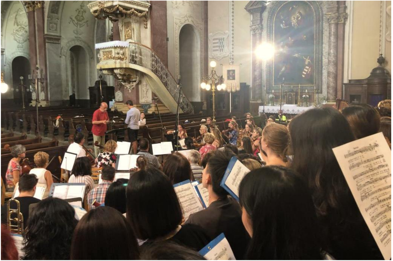
柯达伊艺术节音乐会