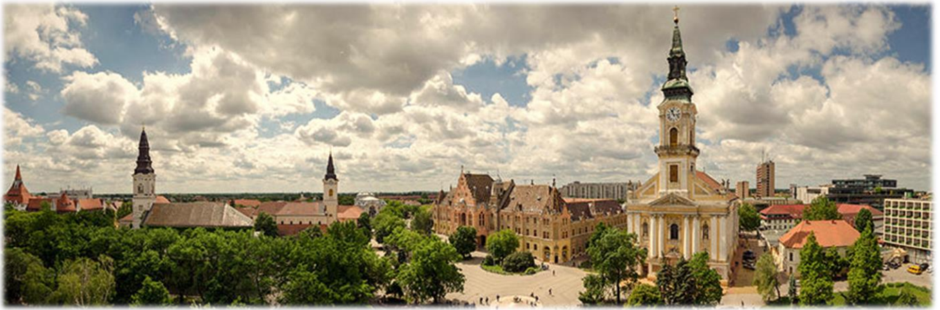
柯达伊故乡-凯奇凯梅特中心广场

注：出发日期与时间将根据国际航班行程表确认具体，请预留7月18日之后时间，以备提前出发需要。