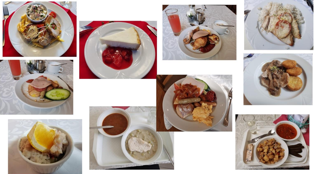
图：丰富的匈牙利特色西餐