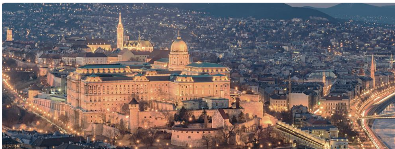
多瑙河畔的布达皇宫建筑群

布达佩斯有着“多瑙明珠”的美誉，被联合国教科文组织列为珍贵的世界遗产之一，曾经被法国人评为“世界上最安静的首都”。登上雄踞在多瑙河畔的盖莱特山，布达佩斯景色一览无余。河西是布达，平缓有丘陵蜿蜒起伏，喀尔巴阡山余脉在这里骤然结束；河东是佩斯，一望无垠的匈牙利大平原在这里发端，一直向东南伸展到匈罗、匈南边境。她是公认的东欧最具浪漫风情的城市。